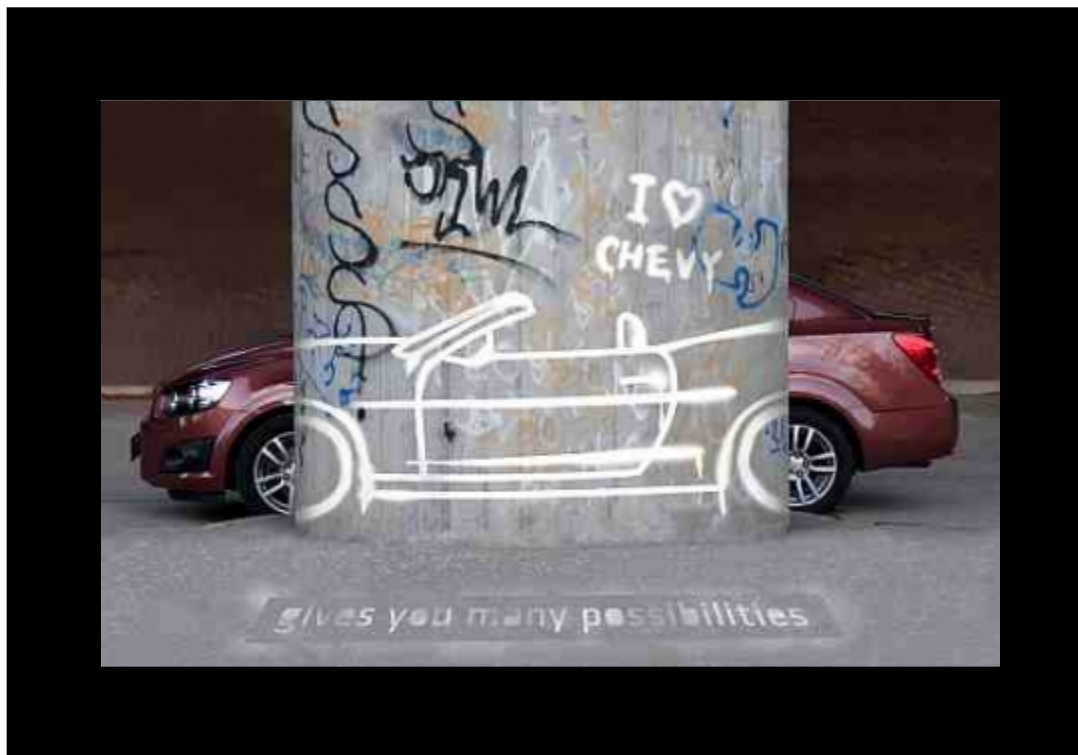
Pobjednička fotografija MKC 2012. Bohuslav Koneš, FA STU, Bratislava Slovačka