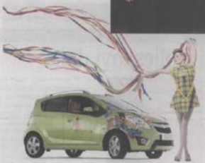
Novi spark s potpisom dizajnerice Mische Woeste

Petrina haljina-cvijet od latice i detinca dobro je odgovorila na kriterije natječaja (kreacija i inovacija, interpretacija brenda, umjetnička kvaliteta i mogućnost komunikacije brenda), a njih, kako su na slavljenoj večeri često ponavljale, veselila još više, kad su vidjele u kakvoj su konkurenciji osvojile