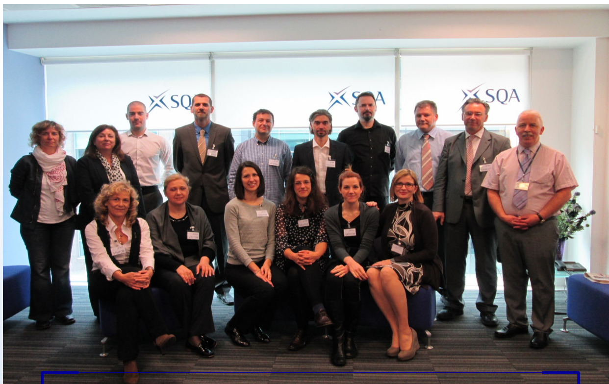
Studijski posjet Škotskoj u sklopu projekta Konkurentno hrvatsko visoko obrazovanje za bolju zapošljivost .

Osim potpore razvoju nacionalnog modela priznavanja i vrednovanja prethodnog učenja u Hrvatskoj, cilj je projekta dati doprinos provedbi Hrvatskog kvalifikacijskog okvira i reformi visokog obrazovanja u Hrvatskoj, kako bi se potaknuo razvoj novih poslova i omogućila fleksibilnost radne snage. Ovaj projekt pridonijet će razvoju Hrvatskog kvalifikacijskog okvira, čime se uređuje sustav kvalifikacija, njihova transparentnost, kvaliteta i relevantnost.